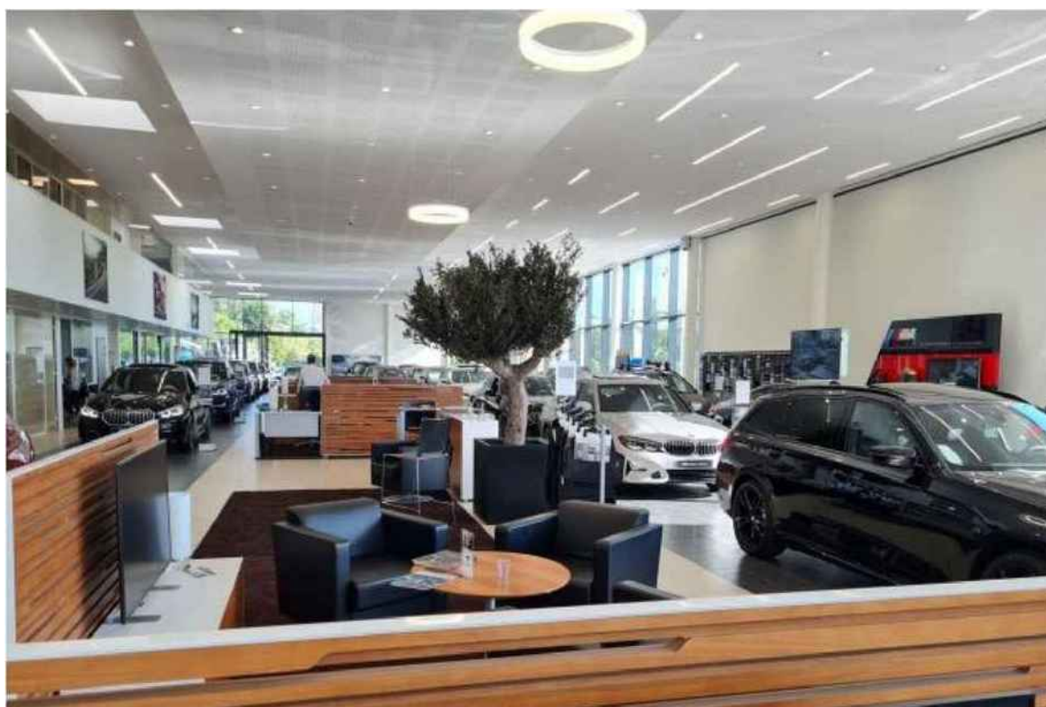
BMW-Mini à Saint Ouen l'Aumône est le siège du groupe Horizon