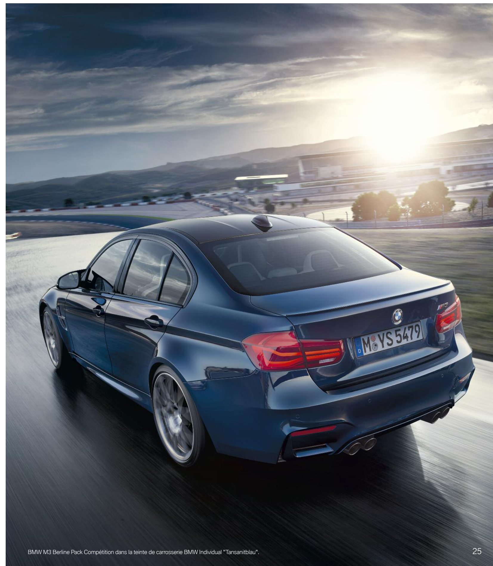
BMW M3 Berline Pack Compétition dans la teinte de carrosserie BMW Individual "Tansanitblau".