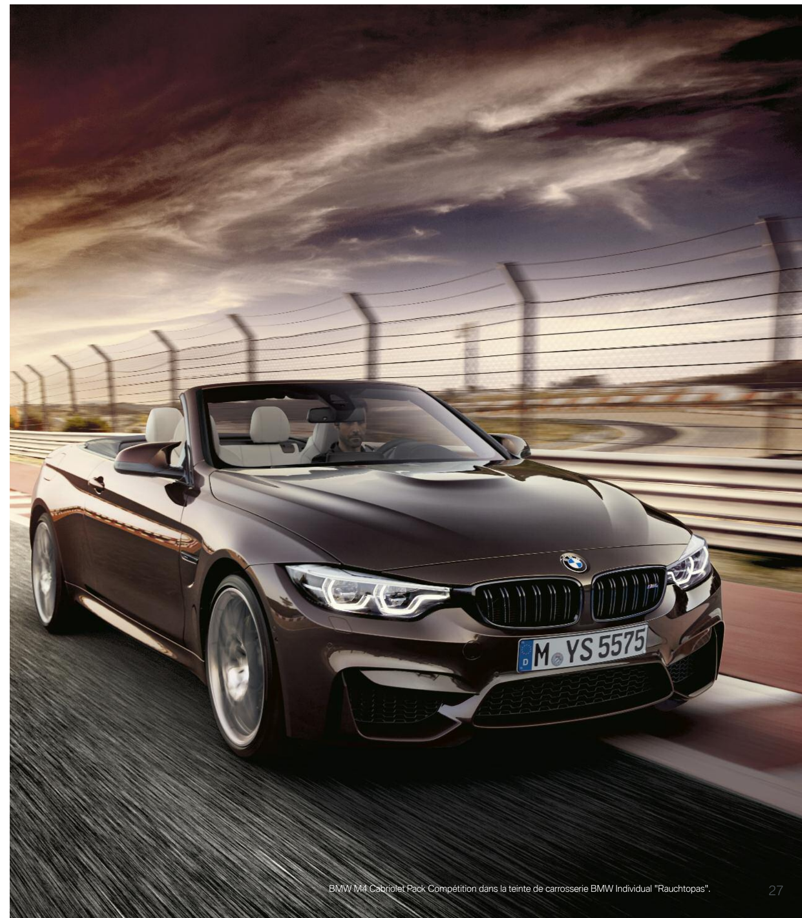
BMW M4 Cabriolet Pack Compétition dans la teinte de carrosserie BMW Individual "Rauchtopas".