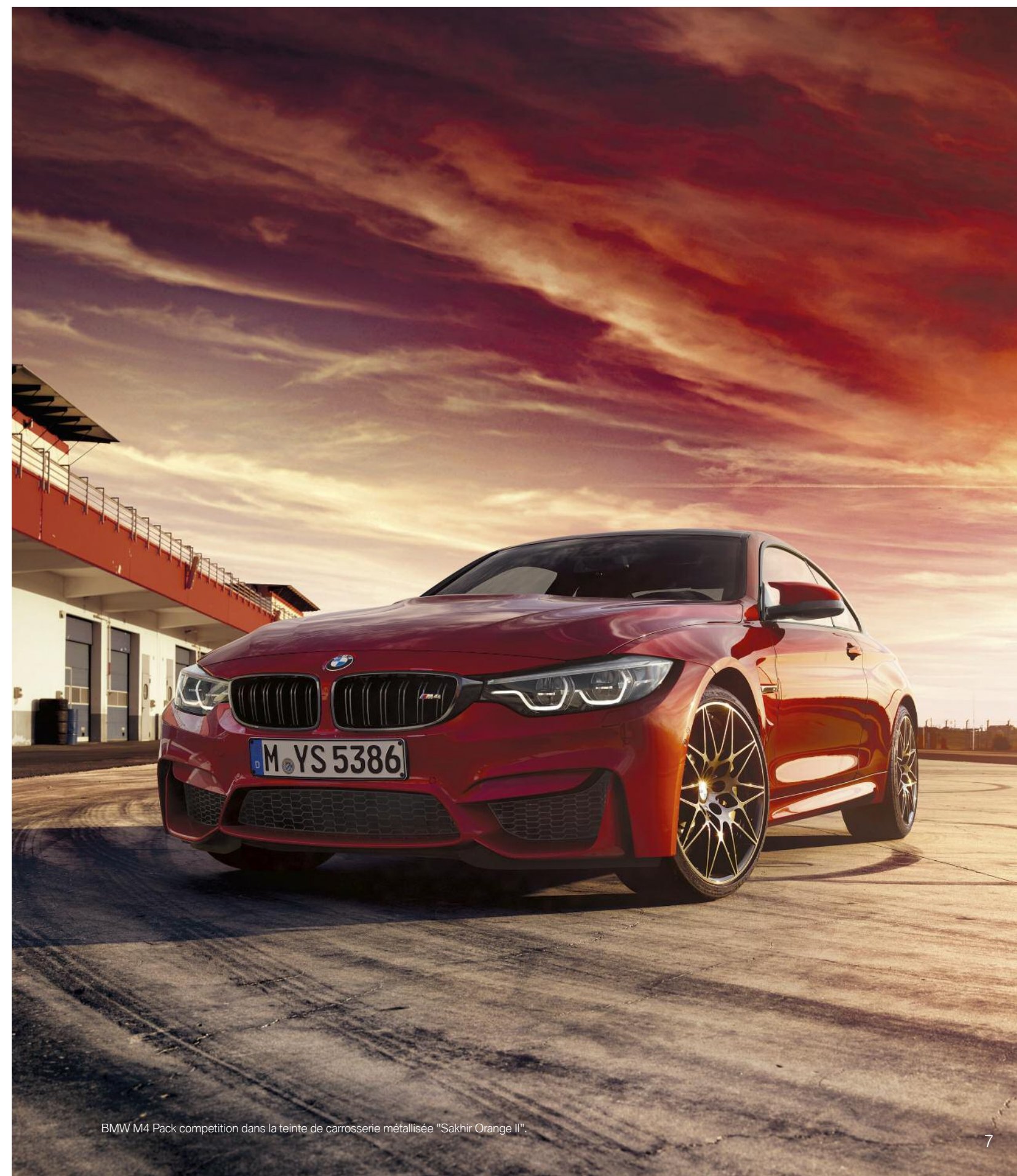
BMW M4 Pack competition dans la teinte de carrosserie métallisée "Sakhir Orange II".