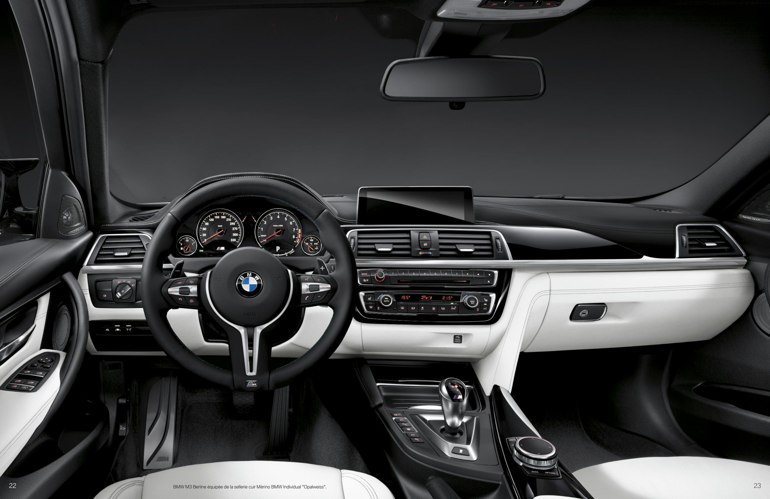
BMW M3 Berline équipée de la sellerie cuir Mérino BMW Individual "Opalweiss".